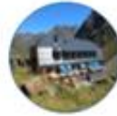
Hütten & Wege

Deutscher Alpenverein Sektion Münster e.V./DAV Wir lieben die Berge! Wir schützen Natur! Wir sind viele!